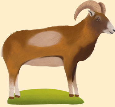
Anadolu Yaban Koyunu