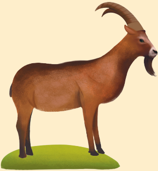
Çengel Boynuzlu Dağ Keçisi